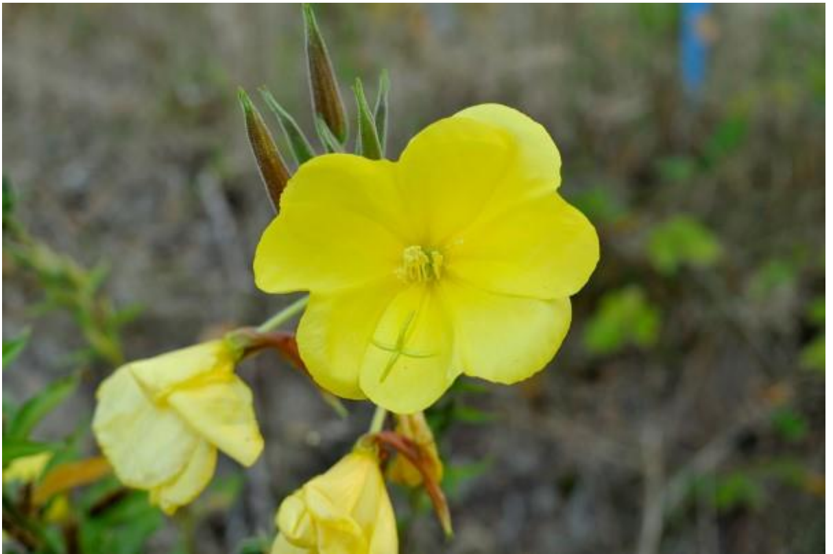
Dit zou dan toch een grote teunisbloem zijn