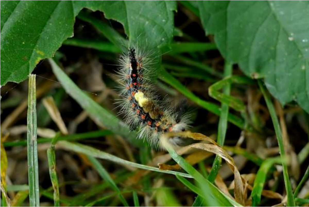
Dit is de rups van de witvlakvlinder